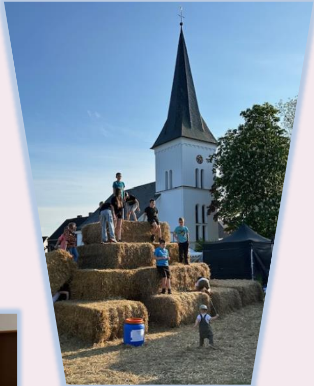
Die Kinder hatten auf der Strohburg besonders viel Spaß