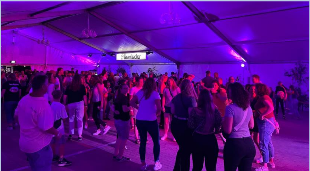
Partystimmung im Festzelt

Für das leibliche Wohl sorgten ein Waffelstand, der Getränkewagen sowie die fleißigen Männer an Grill und Fritteuse mit Bratwurst, Currywurst und Pommes. Um 19 Uhr begann die Festzeltparty mit der Band TTB, die wie schon beim Bauernmarkt für eine Superstimmung sorgte. Angesichts des sehr warmen Wetters dauerte es ein wenig bis die Besucher von der Festwiese ins Zelt wechselten, aber als um 21.30 Uhr DJ Skeeto übernahm, war die Party in vollem Gange.