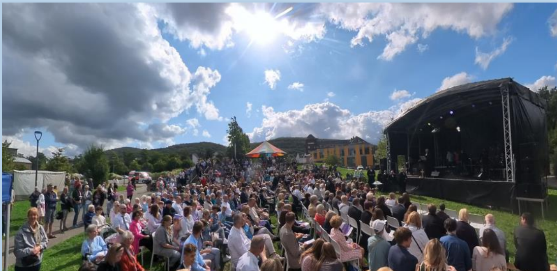
Viele Menschen sind der Einladung des Kirchenkreises gefolgt