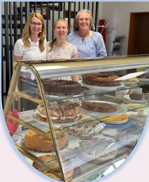
Die Gäste hatten eine große Auswahl an leckeren Kuchen und Torten