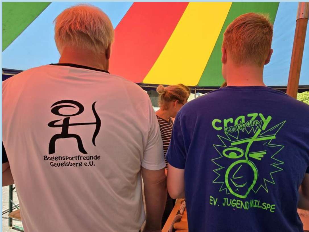
Das Team der Bogensportfreunde Gevelsberg e.V. brachten den Jugendlichen das Bogenschießen näher