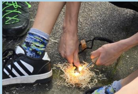
Die Jugendlichen konnten lernen wie man Feuer macht mit einem Zündstahl