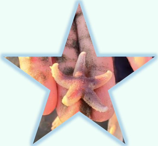
Eindrücke von der Segelfreizeit auf der „Larus“