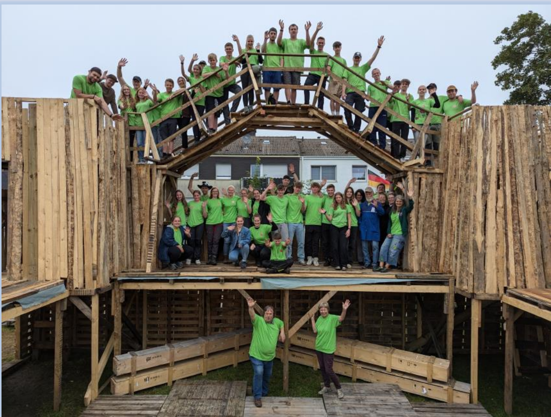
Das Bauspielplatzteam hat mit den Kindern wieder tolle Bauwerke erschaffen

Glücklich, dass ich all das erleben darf: All die lachenden Kinder; all die Momente mit den Mitarbeitern. Ich bin glücklich, Teil dieses unglaublichen Teams zu sein. Ich bin glücklich zu spüren, dass der ganze Tag gesegnet war. Ich schließe die Augen und freue mich schon darauf, am nächsten Tag für den Bauspielplatz wieder aufzustehen. Wahrscheinlich übermüdet... aber auf jeden Fall glücklich.