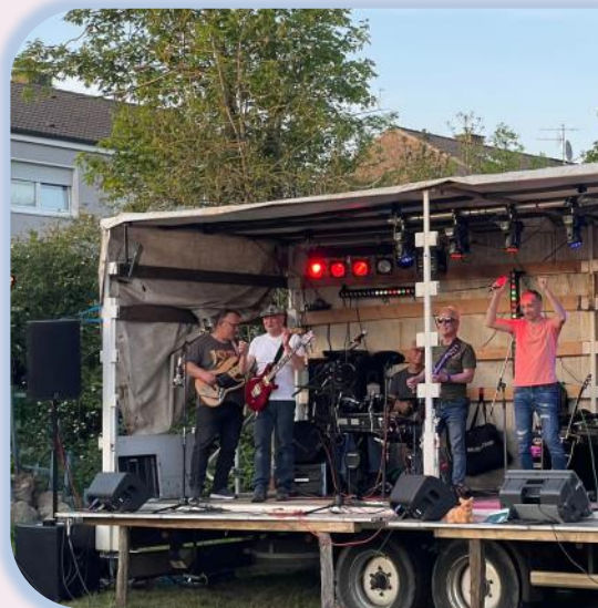
Grandiose Stimmung beim Auftritt von TTB

Ein Highlight am Samstagabend war das Konzert der heimischen Band TTB, bei dem viele Besucher fröhlich mitfeierten. Die Band spendete die Hutgagge in voller Höhe dem Bauspielplatz.