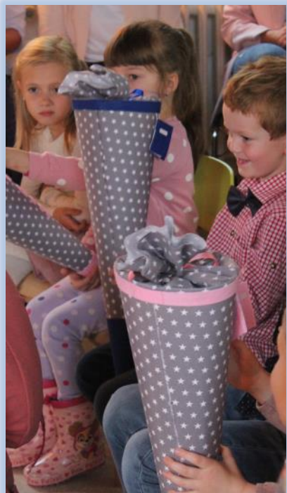
Alle Maxi-Kinder bekamen eine Schultüte