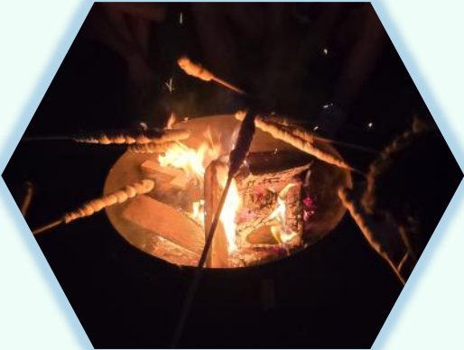
Es gab Stockbrot am Lagerfeuer